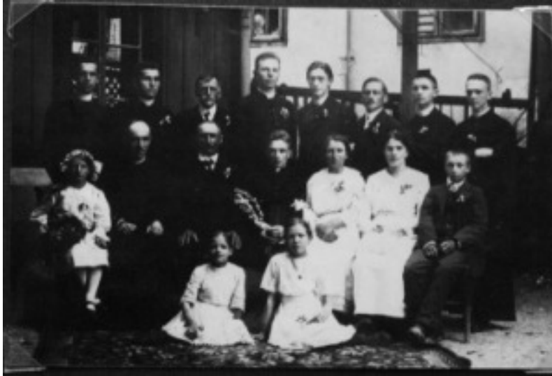
Vir: Breclj 1992, 9