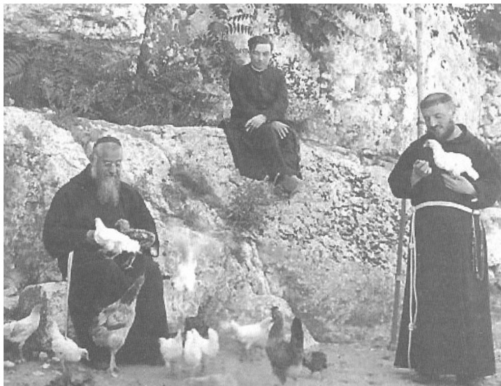
Slika 8: Konfinacija v Campobassu v kapucinskem samostanu 1932