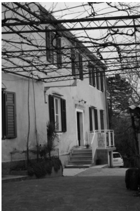
Slika 1: Terčeljeva rojstna hiša Šturje 90 (danes Grivče 6)