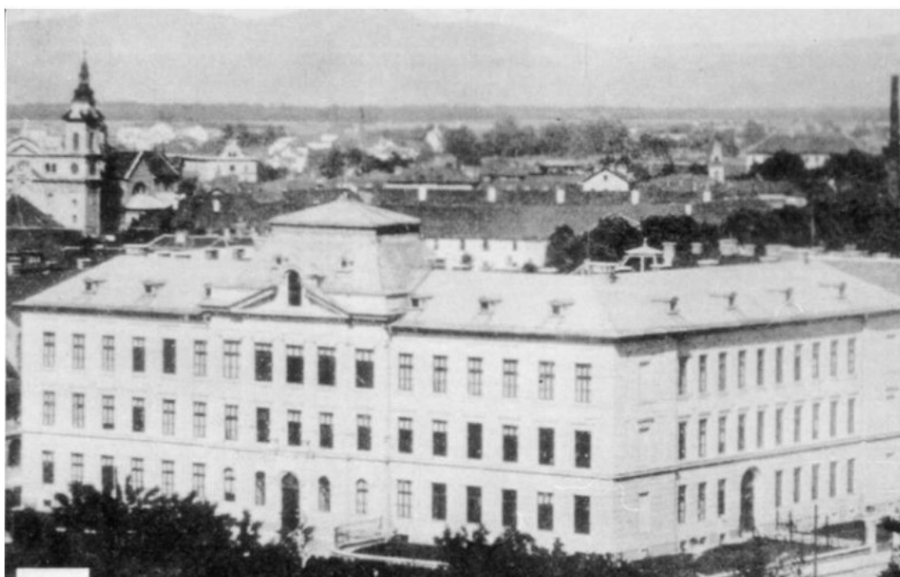
Slika 12: Profesor verouka na II. državni poljanski gimnaziji