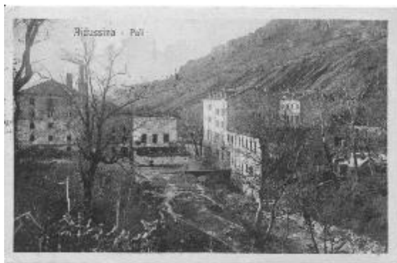
Slika 11: Elektrarna Pale ob Hublju, kjer se je skrival Filip Terčelj