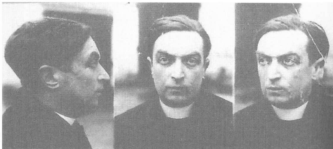
Slika 7: Zaporniška slika iz policijske kartoteke 1931